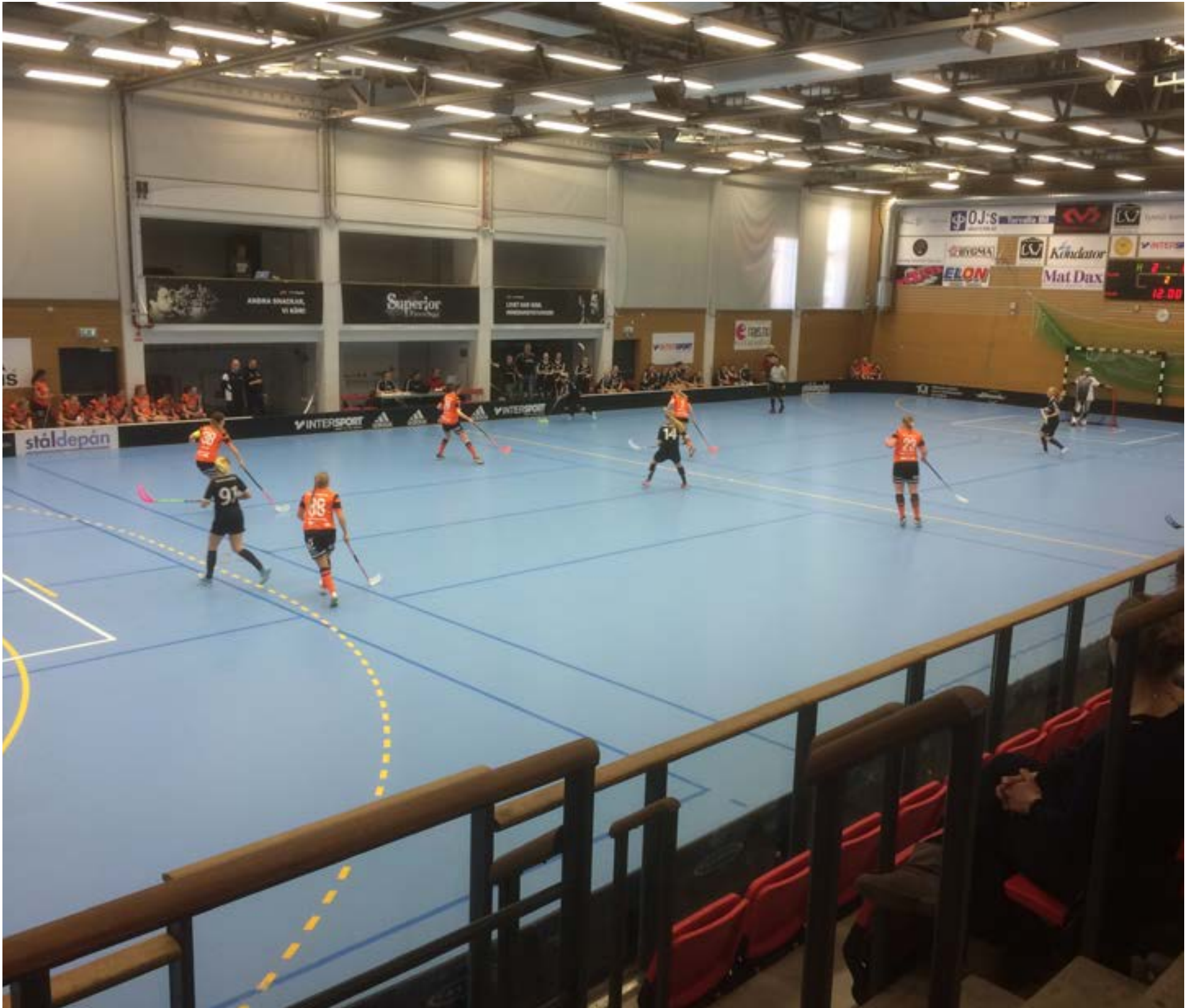
IKSU Försökte att pressa TT högt upp i banan, en taktik som inte riktigt lyckades.