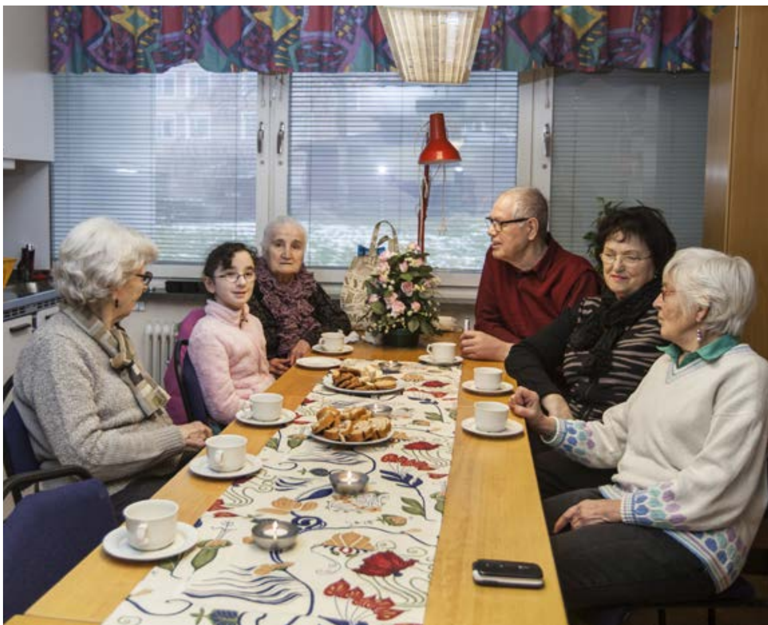
Samtalet om språk, kultur och historia i olika länder i full gång!