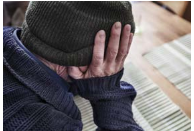
Sjukskrivningstalen ökar i Tyresö.