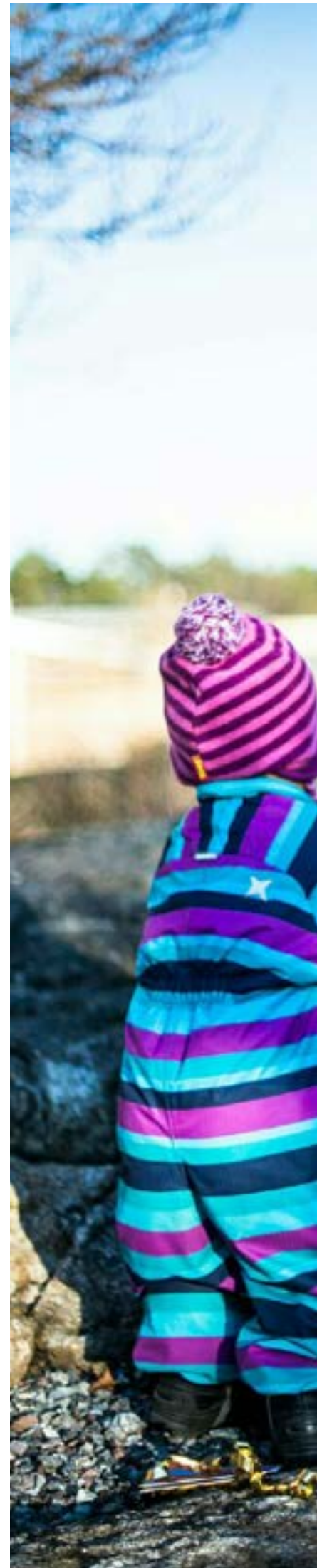
Alla barn behöver bli sedda. Det handlar om