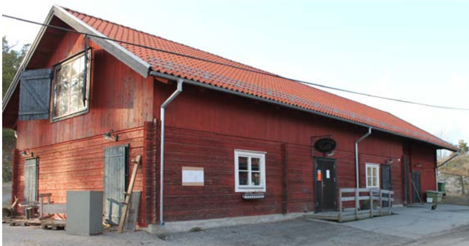
Snart kommer det återigen sjuda av liv och rörelse på Uddby gård.

Enligt arrendeavtalet ska Uddby gård fortsätta att bedriva jordbruk med naturvårdsinriktning men medger också möjligheter till kompletterande verksamheter liknande de man nu fått godkänt av kommunen att arbeta vidare med. När de nya verksam-