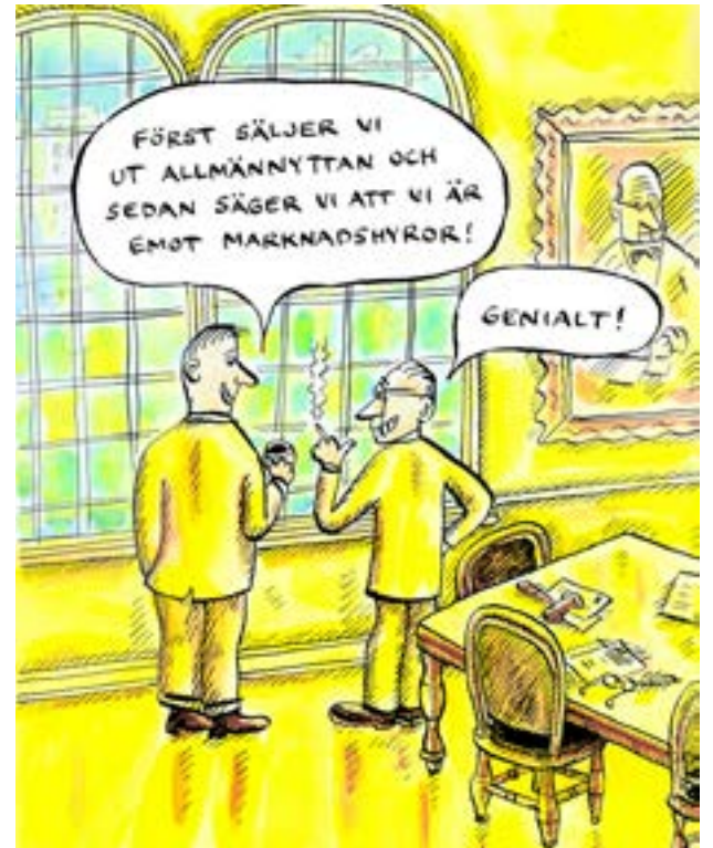
ILLUSTRATION: ROBERT NYBERG