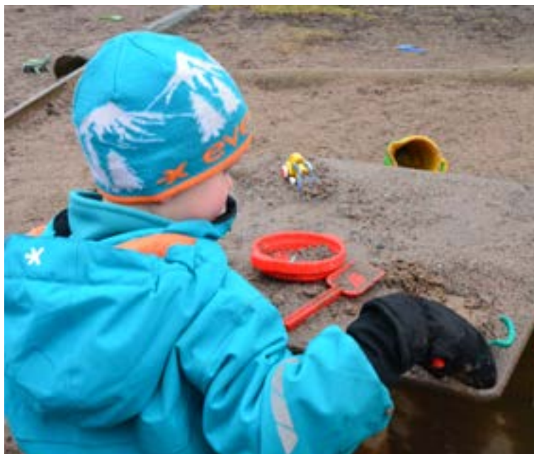
I Tyresö är barngrupperna historiskt stora. I en jämförelse med Sveriges kommuner, placerar sig Tyresö bland den sämsta tredjedelen avseende kostnad/inskrivet barn.