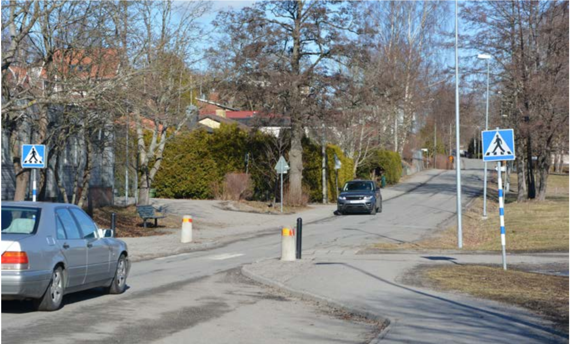
Redan idag är trafiken kaosartad varje morgon och eftermiddag utanför Fornuddens skola. En fördubbling av skolan kan öka trafiken avsevärt.