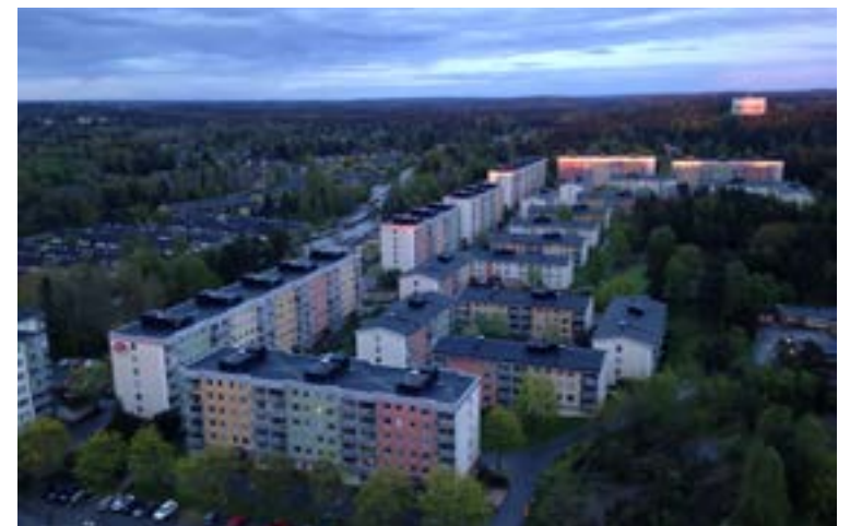
Vackra Tyresö sett från ovan.