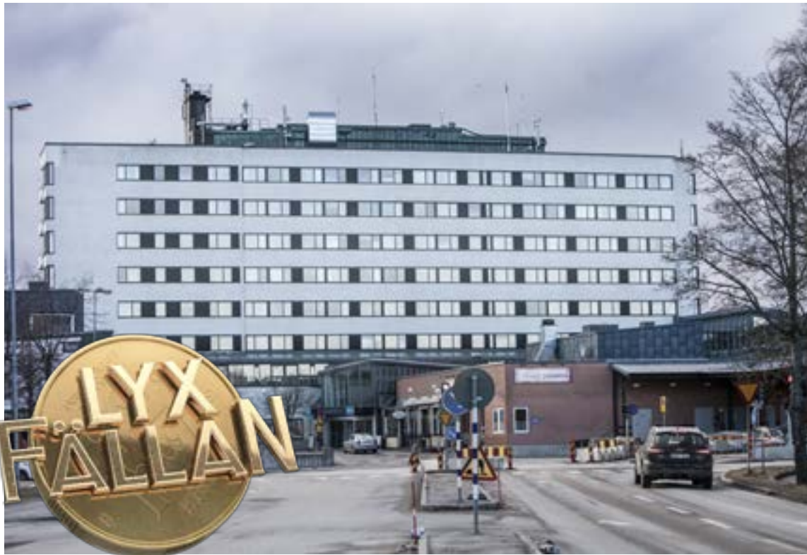
Lyxfällan är ett tv-program med personer som lever över sina tillgångar. Om målgruppen var kommuner skulle Tyresö kvalificera sig.

För att ha en god ekonomisk hushållning bör kommunens resultat