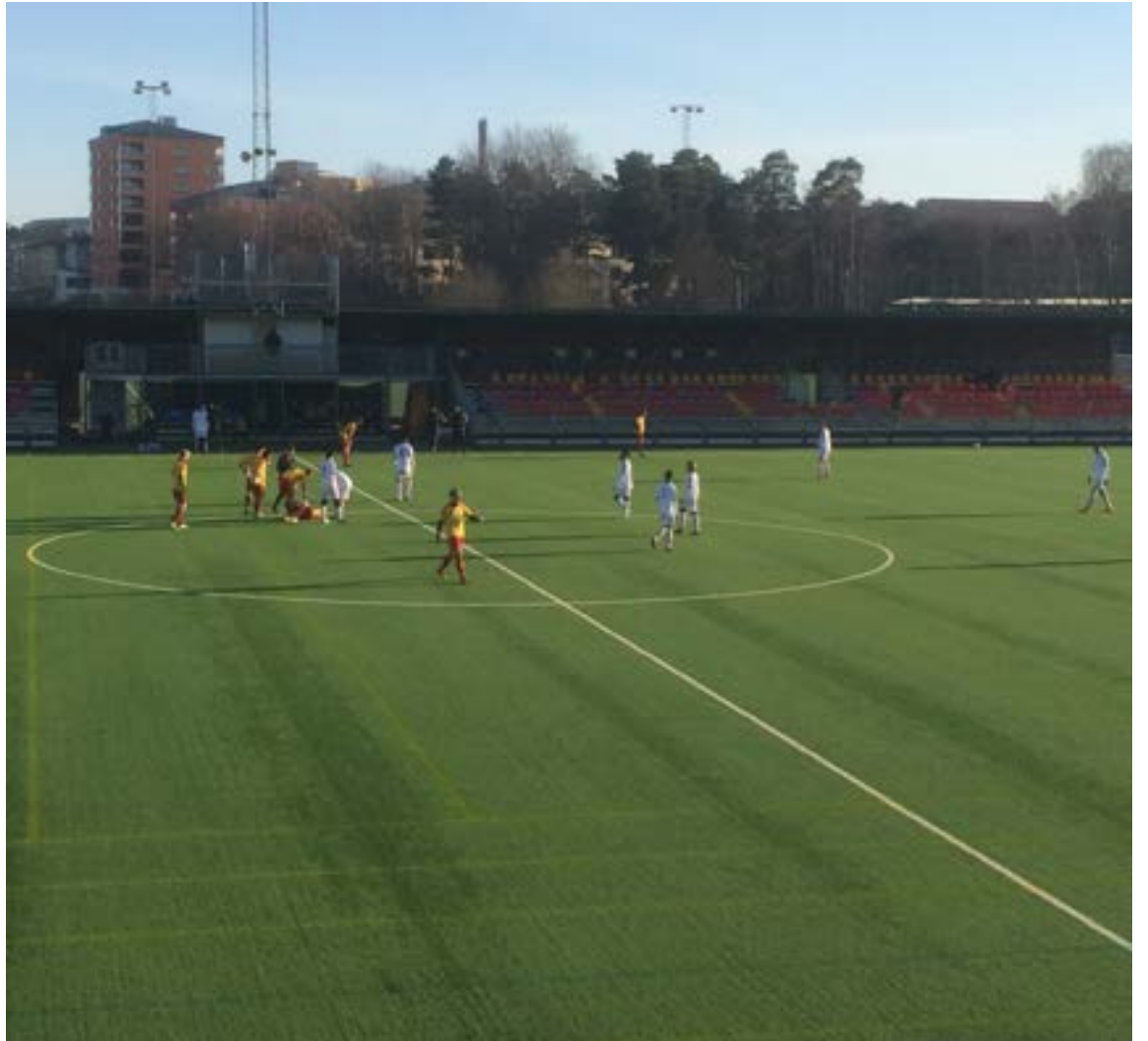
Publiken uteblev helt i det underbara vädret. Var alla hemma och blandade dipp till Mello?