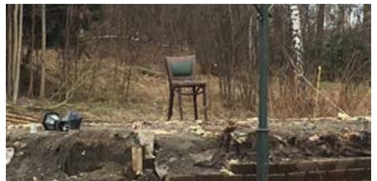
Slut på sittplatser i gamla Curras corner.