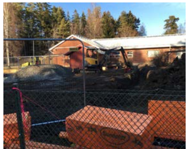
Baracker på gång vid Kardemumman.