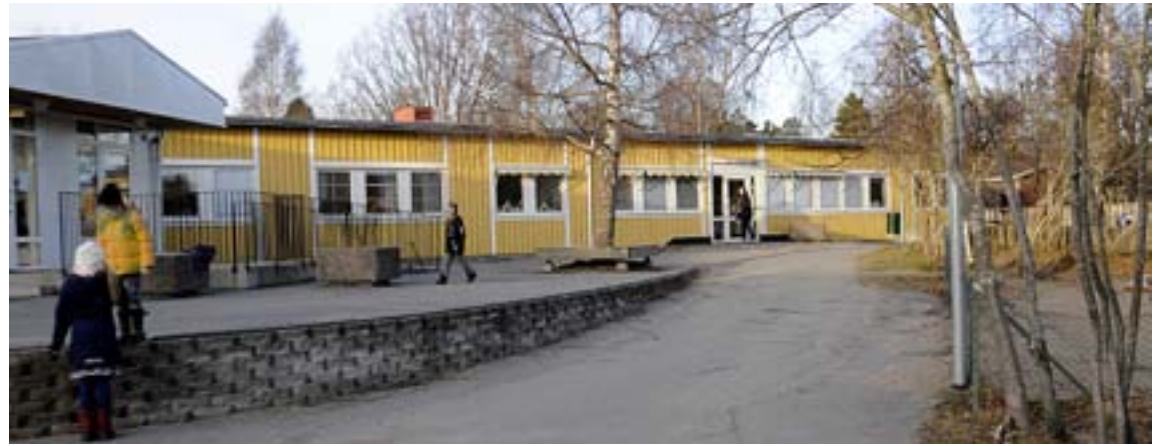
Sofiebergsskolan kan komma att omvandlas till en två-parallellig F-3 skola.