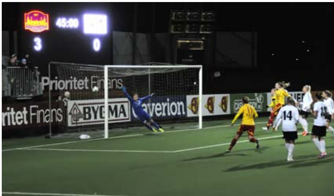
4-0 sitter och TFF är definitivt vidare till kvartsfinal i Women's Champions League.

Nu väntar kvartsfinal mot österrikiska mästarennorna från SV med först hemmamatch den 23 mars och veckan därpå bortamatch i Neulengbach, drygt 40 kilometer väster om Wien.