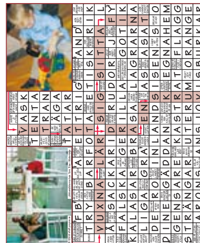
Rätta lösningen på kryss nr 7, 2013.