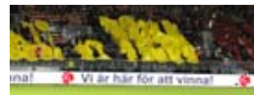
Vi är här för att vinna! □□□

S i Tyresö hade dessutom satt upp "Vi är här för att vinna", på den rullande rinkreklamerna, vilket Tyresö FF mer än väl levde upp till hela kvällen!