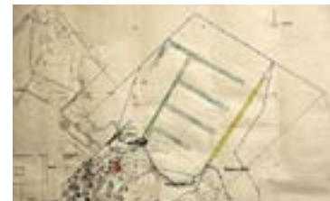
Här är ett förslag från båtklubben.

MARINA I en tidigare notis om båtklubben vid Tyresö Strand kunde man få uppfattningen att Tyresö Strands båtklubb inte deltar i utformningen av den framtida marinan. Det är inte sant och beror på en olycklig formulering.