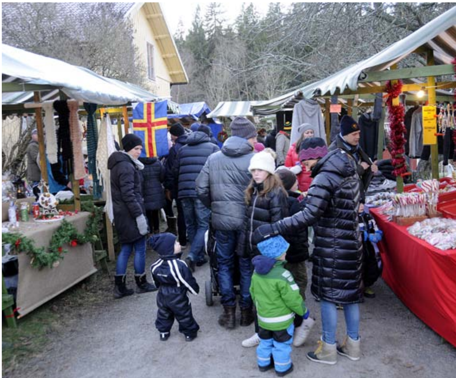
Julmarknaden vid Prinsvillan i Gamla Tyresö är en fin tradition för både stora och små.