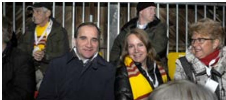
Glada mineri i publiken.