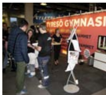
Tyresö gymnasiums mässmonter.

Den som vill ha riktigt mycket information om Tyresö gymnasium kan också gå till gymnasiets hemsida men länk till gymnasiets katalog för 2014.