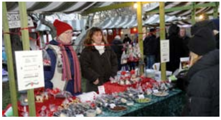
Mandelmassefigurer från Tyresö till jul är aldrig fel.